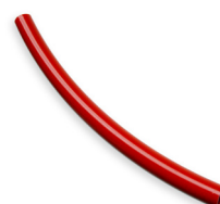
Anti-Kalk-Bypass Schlauchstück Ø 8mm 295 4,00 €