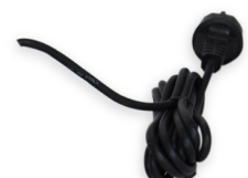
Kabelverlängerung auf 10 Meter 20 230V 35,29 €

Für weitere Informationen schauen Sie bitte im Netz unter www.royal-exclusiv.de . Einfach Artikelnummer oder Name in die Suchmaske eintragen oder email an: info@royal-exclusiv.de .