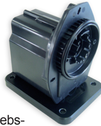
Antriebs- motor mit Bodenplatte