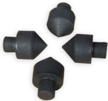
GummifüÙe 4 Stück