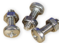
Pumpenkopfschrauben 3 St. M4 x 16mm V4A