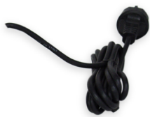
nur bei Neukauf Kabellänge 10 Meter