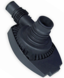
Pumpenkopf PVC grau