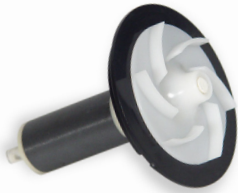
Rotor/Laufraadinheit 5,0m 3 (Keramik)