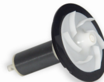
Rotor/Laufraadinheit 5,0m 3 (Metall)