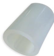
Entkopplersatz 15cm 120-22 12,00 €