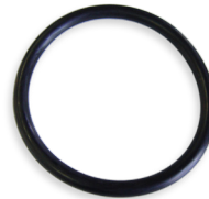
Motorblock Dichtungsgummi 65 x 4mm 171 4,00 €